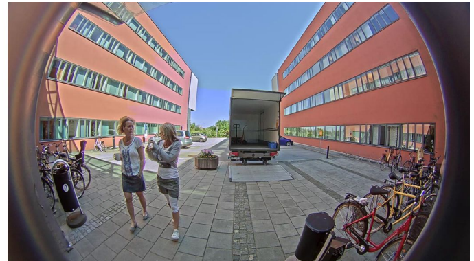
Изображения сверху получены с помощью камеры AXIS F41 с функцией WDR – Forensic Capture; отчетливо видны детали и в светлых, и в темных областях. Изображение слева получено со стандартным объективом в условиях яркой фоновой засветки. Изображение справа получено объективом "рыбий глаз" AXIS F1035-E при очень контрастном освещении.