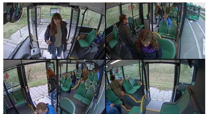
Слева показана схема размещения в автобусе модуля AXIS F44 (с локальным хранилищем данных на картах SD), оптического модуля AXIS F1005-E и микрофона. Справа представлено изображение, полученное внутри автобуса в режиме квадратора.